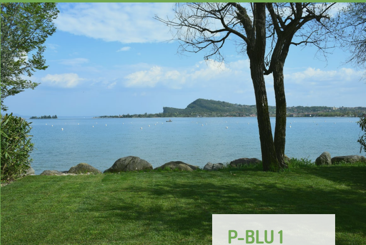
P-BLU 1 55-65 m 2