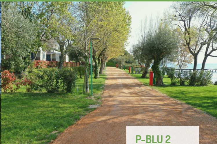
P-BLU 2 50-55 m 2