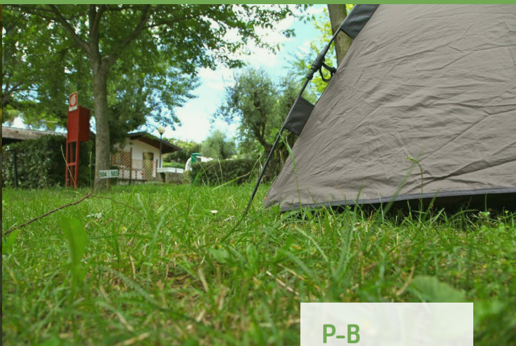
P-B 35-50 m 2