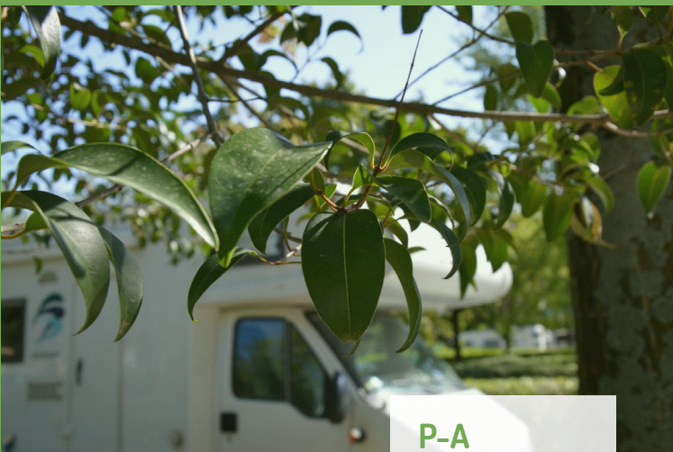
P-A 45-65 m 2