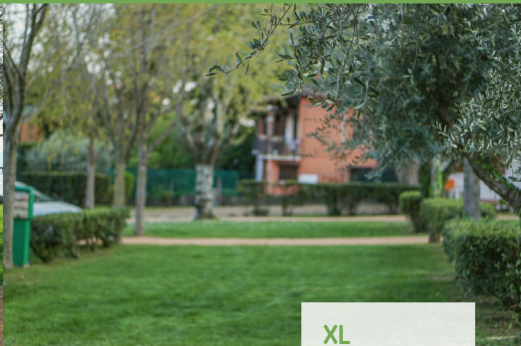
XL 110-135 m 2